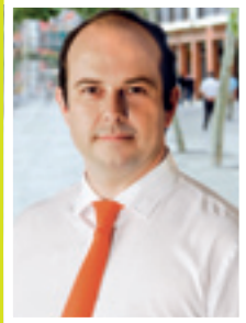
Pedro Rollán Ojeda Alcalde Torrejón