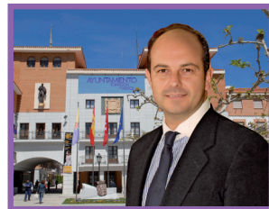
Pedro Rollán Ojeda Alcalde de Torrejón de Ardoz