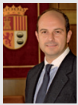
Pedro Rollán Ojeda Alcalde de Torrejón de Ardoz