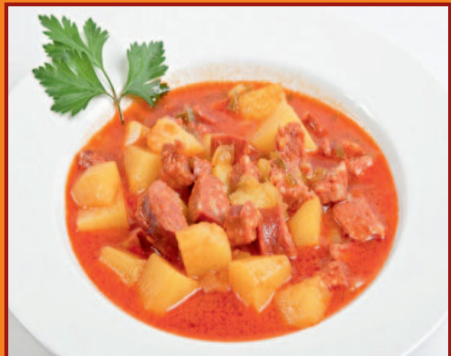
c/ Virgen de la Paloma, 16