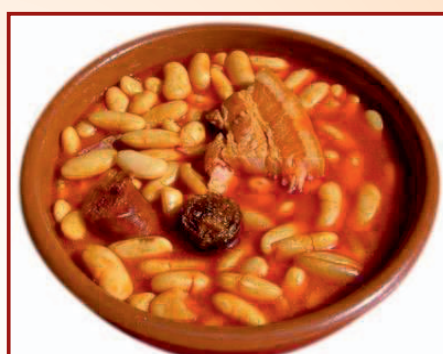
c/ Ronda de Poniente, 13