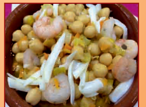
c/ Virgen de Loreto, 49