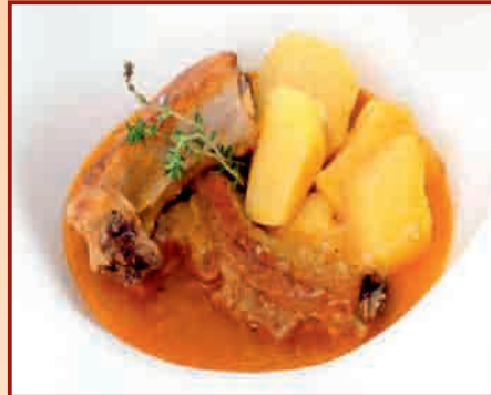
c/ de los Curas, 1