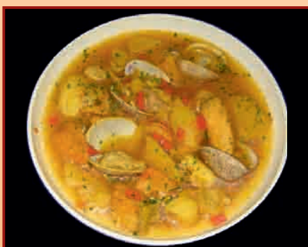
c/ de la Cruz, 27