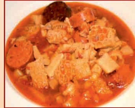
C/ Ajalvir, 2

CERVECERÍA LA CRUZ 24 Garbanzos Pedrosellanos al estilo del Chef