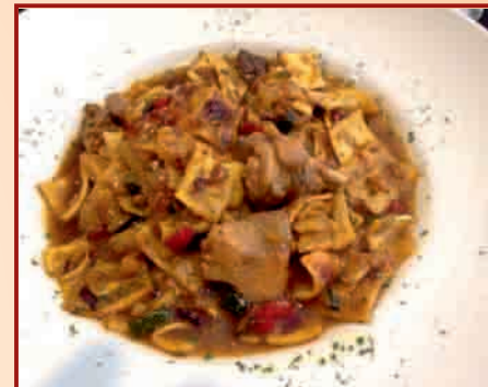
c/ de la Soledad, 24