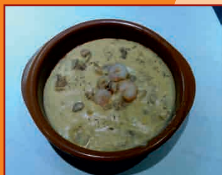
c/ Virgen de la Paloma, 6

BAR EL TIO DE LA BOTA Crema de Garbanzos con Setas y Gambas