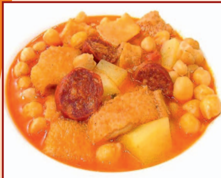
Plaza Mayor, 11