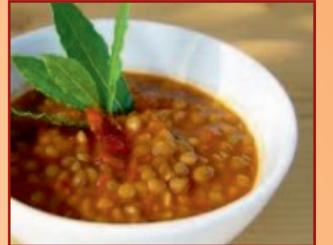
c/ Jabonería, 16

BAR VERDOLAGA Puchero de Lentejas de la Abuela