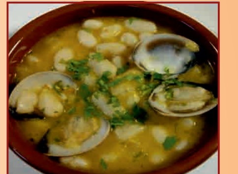
c/ Virgen de Loreto, 8