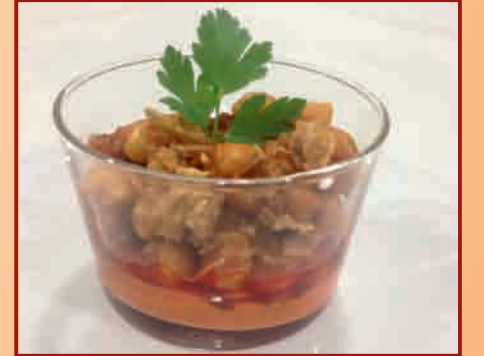
C/ de la Cruz, 24

CERVECERÍA LA CRUZ 24 Garbanzos Pedrosellanos al estilo del Chef