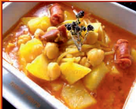
c/ Soledad, 15