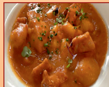
c/ Veredillas, 1 (esq. Virgen de Loreto)