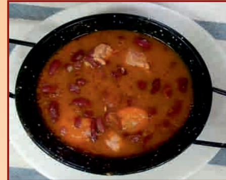
c/ Hospital, 5

BAR VERDOLAGA Puchero de Lentejas de la Abuela