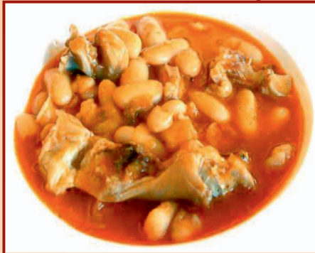
c/ Las Cabilas, 24