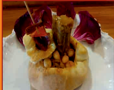
c/ Enmedio, 5

COMUNIDAD DE LA TAPA Hasta el Rabo todo es Toro