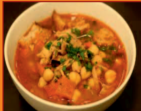
c/ Ramón y Cajal, 7