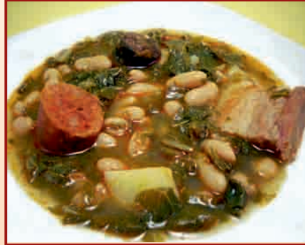
Plaza Mayor, 8