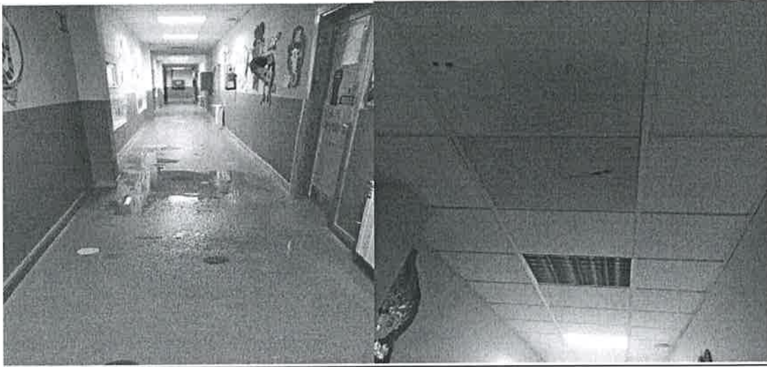
CEIP LA ZARZUELA.