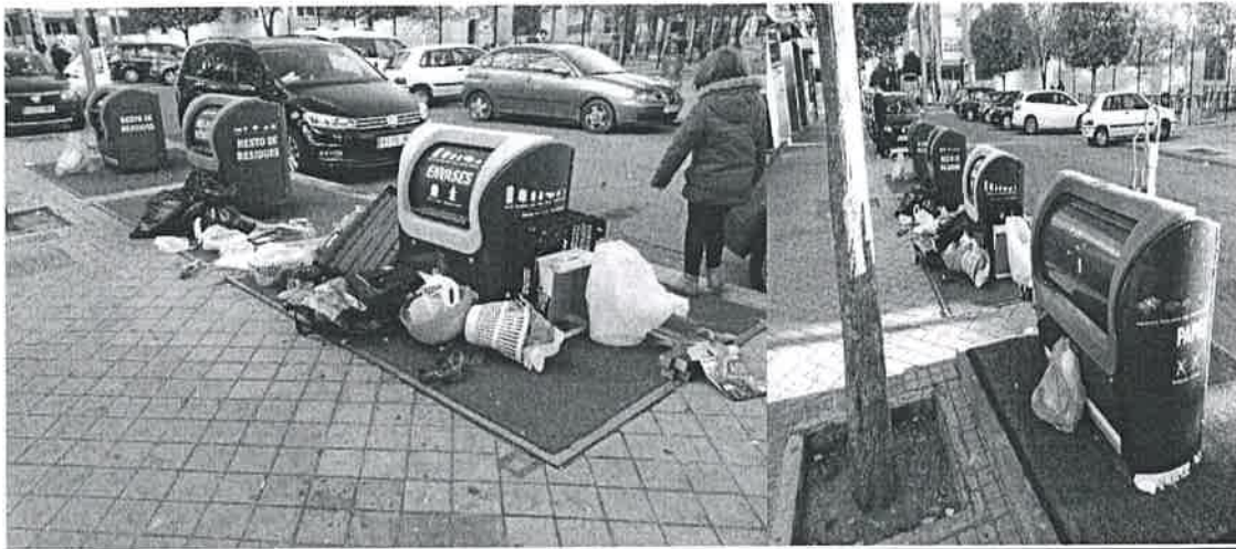
CONTENEDORES FRENTE AL CEIP LA ZARZUELA. Nueve de la mañana.