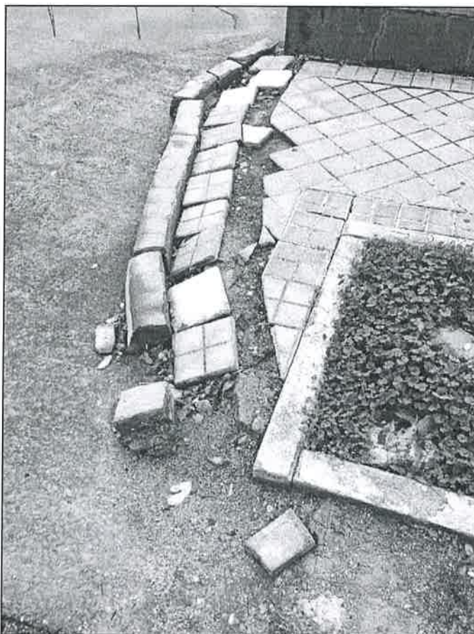
Imagen de la Calle Brújula, calle de acceso al Parque Europa

Torrejón de Ardoz, 24 de noviembre de 2016 . Fdo: Guillermo Fouce. Portavoz Grupo Mpal. PSOE