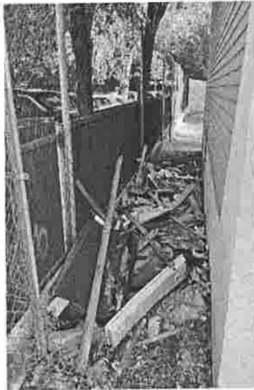
Pasillo Transformador junto a Cellosa

La mejora en limpieza viaria debe ser notable y urgente, hay zonas que presentan un estado de abandono preocupante, que sonrojan con solo miraras. Se tiene que hacer un esfuerzo importante para mejorar de forma sustancial la limpieza de las calles y zonas verdes.