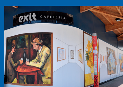
12 IMPRESIONISTAS Plaza de España Autor: Manuel Ojeda / 2011.