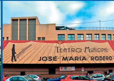
EL ESCENARIO DE LA VIDA C/ Londres Autor: Manuel Ojeda / 2015.