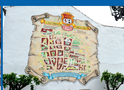
EL MAPA DE TORREJÓN SIGLO XVII Plaza del Museo Autor: Manuel Ojeda / 2011.