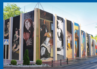
ÉPOCAS DE LA PINTURA ESPAÑOLA C/ Juan XXIII esq. C/ Ronda del Poniente Autor: Manuel Ojeda / 2010.