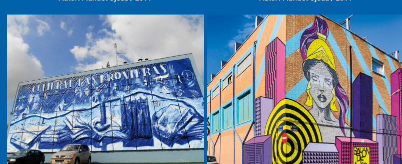
MURAL CENTRO CULTURAL LAS FRONTERAS C/ Salvador Allende, s/n Autores: Lola Remesal y Fernando Plaza / 2010.