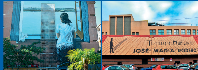
MUCHACHA EN LA VENTANA Avda. Constitución esq. C/ Zaragoza Autor: Manuel Ojeda / 2014.