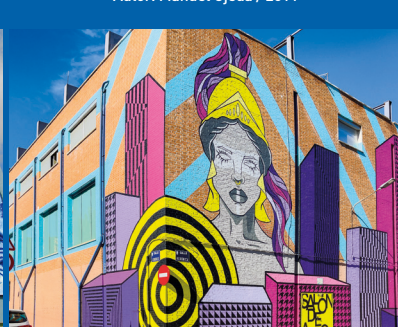
CASA DE LA CULTURA Plaza del Museo Autores: ZOK.ART, Marcos Casero y Esther Moya González / 2021.