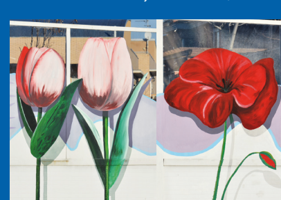
LAS FLORES DEL BIEN Ronda Sur Autor: Manuel Ojeda / 2012.