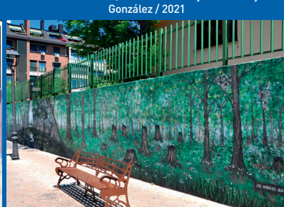
LOS ÁRBOLES QUE FALTAN Parque Constitución Autor: Manuel Ojeda / 2010.