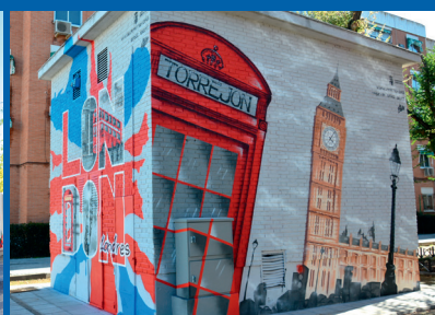
MURAL LONDRES C/ Londres esq. C/ París Autor: Toni Marín La Fumal / 2014.