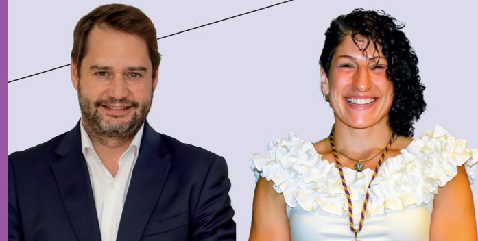
IGNACIO VÁZQUEZ CASAVILLA Alcalde de Torrejón de Ardoz