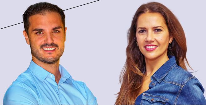
ALEJANDRO NAVARRO PRIETO Alcalde de Torrejón de Ardoz