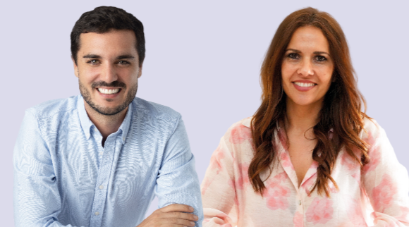
ALEJANDRO NAVARRO PRIETO Alcalde de Torrejón de Ardoz

En este día, aunque nuestro compromiso esté presente todos los días del año, se recordará una vez más la desigualdad existente entre mujeres y hombres y el compromiso firme del Ayuntamiento de Torrejón de Ardoz para seguir trabajando por la Igualdad y eliminar su expresión más brutal que es la violencia de género.