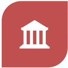
1.- MODELO CORPORATIVO