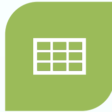
2.- MODELOS PATROCINADOS