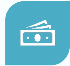
4.- MODELO DE CONTENIDOS DE PAGO