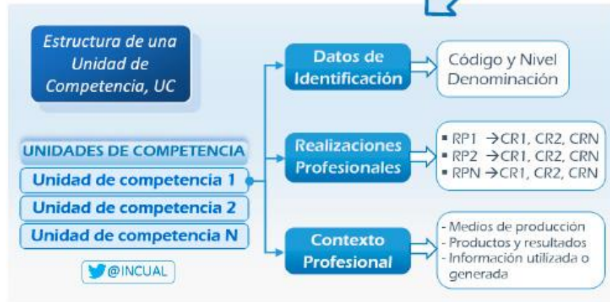
Unidad de competencia, UC: Agregado o conjunto mínimo de competencias profesionales, susceptible de reconocimiento y acreditación parcial.

No se corresponde con una "titulación académica". No se imparten en ningún centro.