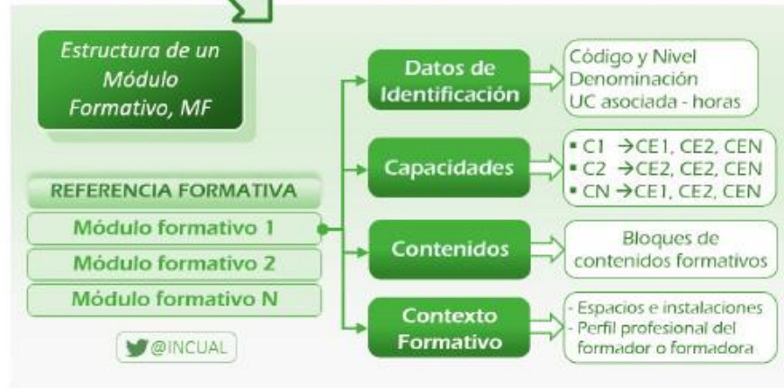
Referencia Formativa, MF: Asociada a cada UC, se expresa en las capacidades (C) y sus criterios de evaluación (CE), los bloques de contenidos y el contexto formativo.