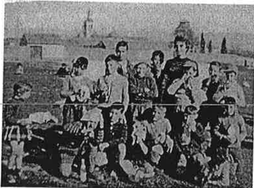
Imagen extraída de: "Torrejón de Ardoz, 50 años de memoria gráfica" Gutierrez de Mesa y Sánchez Ferrera.

Otra de la hipótesis sobre el origen de este festejo es que proviene de la celebración que hacían los agricultores cuando empezaban el periodo de siembra de la patata (de ahí que el alimento principal sea la tortilla). El propio Ayuntamiento, tras unos estudios realizados aseguraba que el Día de la Tortilla está ligado a "el pasado agrícola de nuestra localidad y antaño se aprovechaban las patatas viejas para, con la llegada de la cigüeña por San Blas, reunir a todos alrededor de una tortilla" .