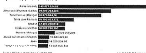
Los diez ayuntamientos con más facturas dentro del cajón