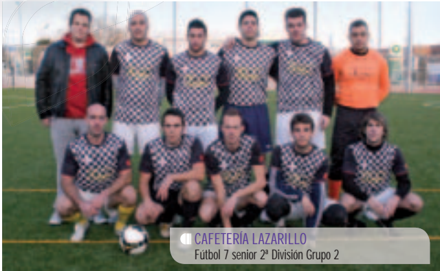
CAFETERIA LAZARILLO Fútbol 7 senior 2ª División Grupo 2