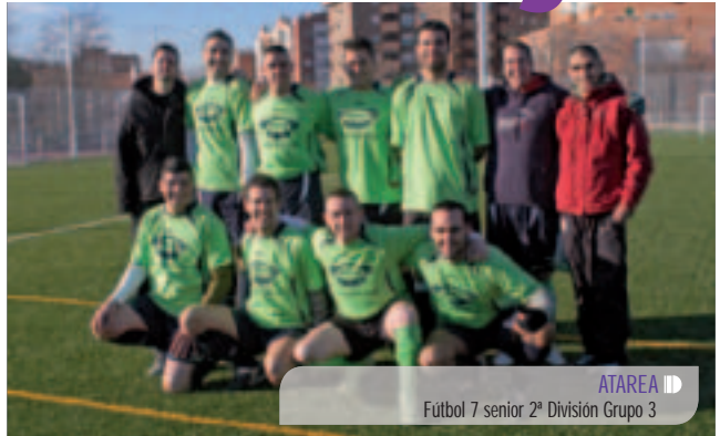
ATAREA Fútbol 7 senior 2ª División Grupo 3