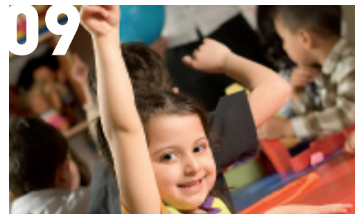
El Ayuntamiento invertirá el Plan E en mejorar 20 barrios y parques y en los colegios del municipio