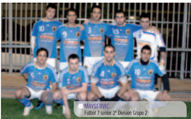
MAYSERVIC Fútbol 7 senior 2ª División Grupo 2