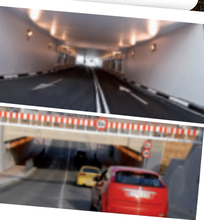
Paso de Loeches Paso de Zapatería