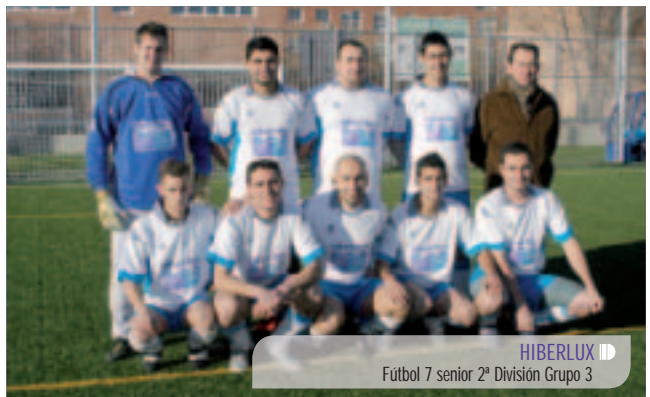
HIBERLUX Fútbol 7 senior 2ª División Grupo 3