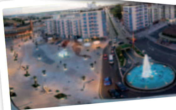
Nueva Plaza de España

Estamos impulsando la ciudad, situándola donde se merece, a la cabeza de las grandes ciudades de la Comunidad de Madrid y sacándola del pelotón de cola donde la había relegado durante muchos años el anterior Gobierno local.