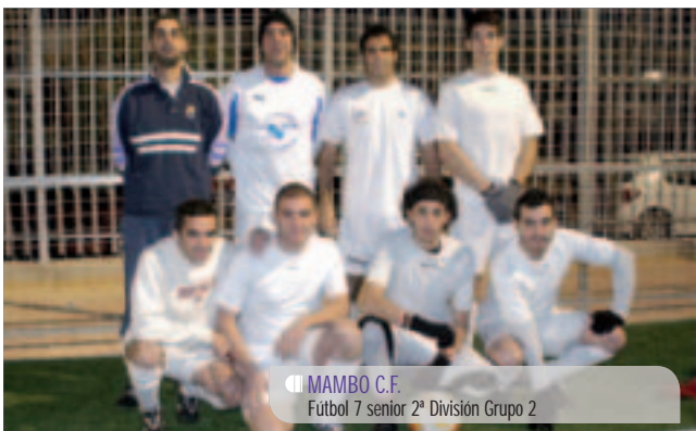
MAMBO C.F. Fútbol 7 senior 2ª División Grupo 2