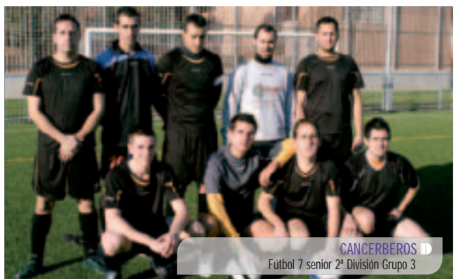
CANCERBEROS Fútbol 7 senior 2ª División Grupo 3