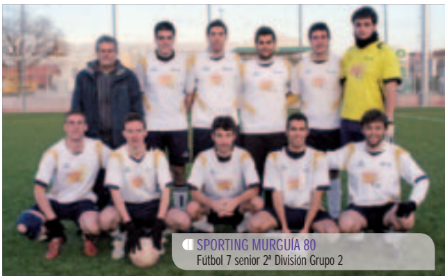
SPORTING MURGUÍA 80 Fútbol 7 senior 2ª División Grupo 2