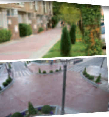
Programa de Mejora de Barrios Plan de Revitalización Zona Centro

Estamos impulsando la ciudad, situándola donde se merece, a la cabeza de las grandes ciudades de la Comunidad de Madrid y sacándola del pelotón de cola donde la había relegado durante muchos años el anterior Gobierno local.