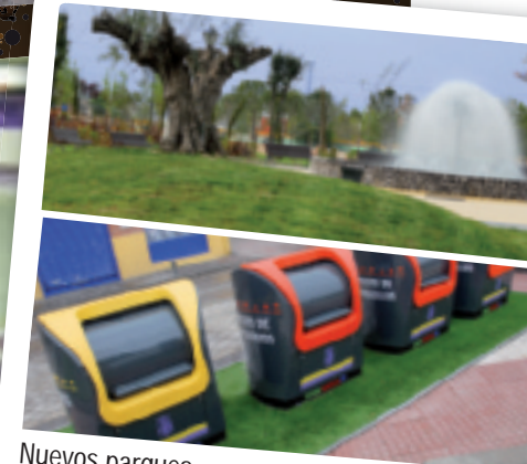
Nuevos parques Contenedores soterrados