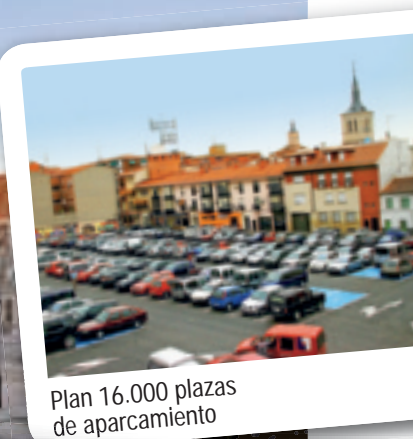
Plan 16.000 plazas de aparcamiento