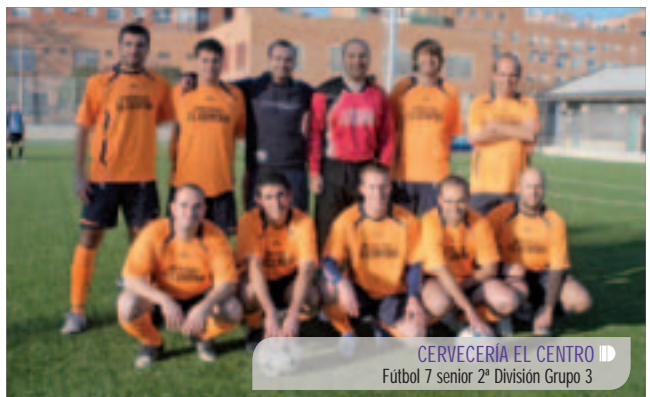
CERVECERÍA EL CENTRO Fútbol 7 senior 2ª División Grupo 3