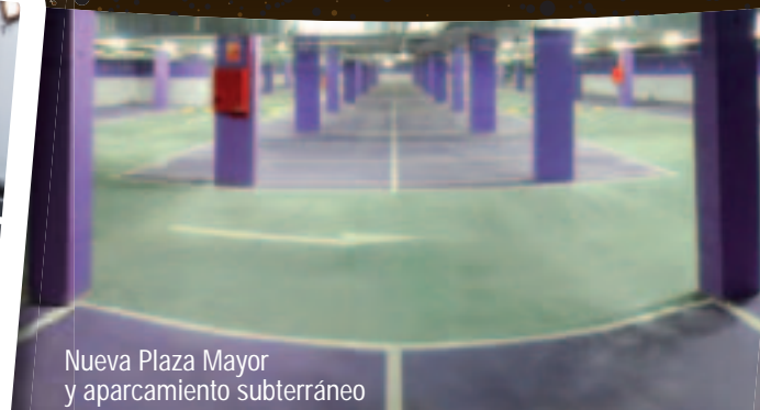
Nueva Plaza Mayor y aparcamiento subterráneo