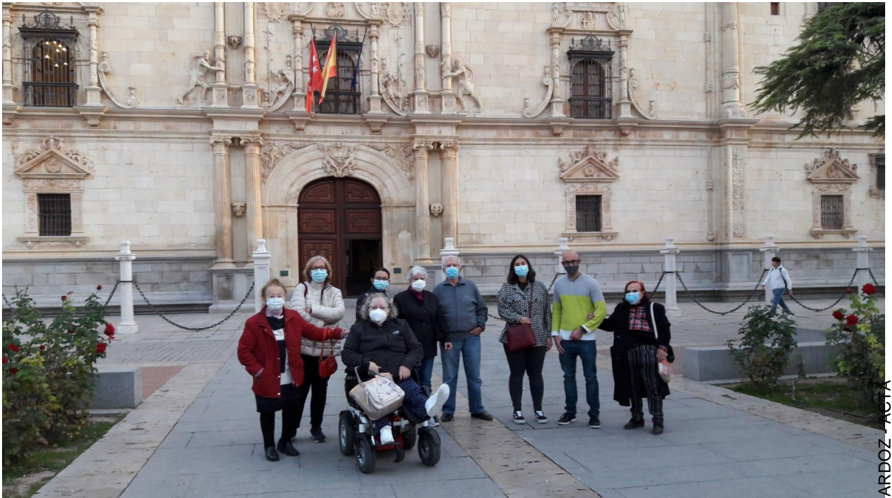
Torrejón de Ardoz

C/ Embajadores 206 Duplicado, 1ºC - 28045 MADRID Tel/Fax. (34) 91 359 93 05 info@amigosdelosmayores.org || http://www.amigosdelosmayores.org